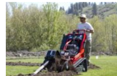
Trancheuse sur chenilles 2036 RTK